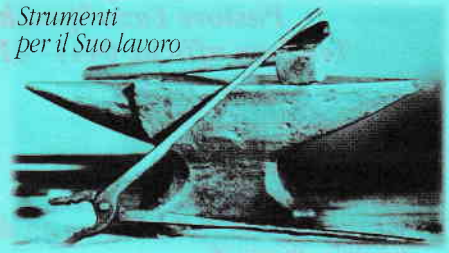
Strumenti per il Suo lavoro

senza vacillare; perché fedele è Colui che ha fatte le promesse. E facciamo attenzione gli uni agli altri per incitarci a carità e a buone opere, non abbandonando la nostra comune adunanza come alcuni son usi di fare, ma esortandoci a vicenda; e tanto più, che vedete avvicinarsi il gran giorno" (Ebrei 10:23-25).